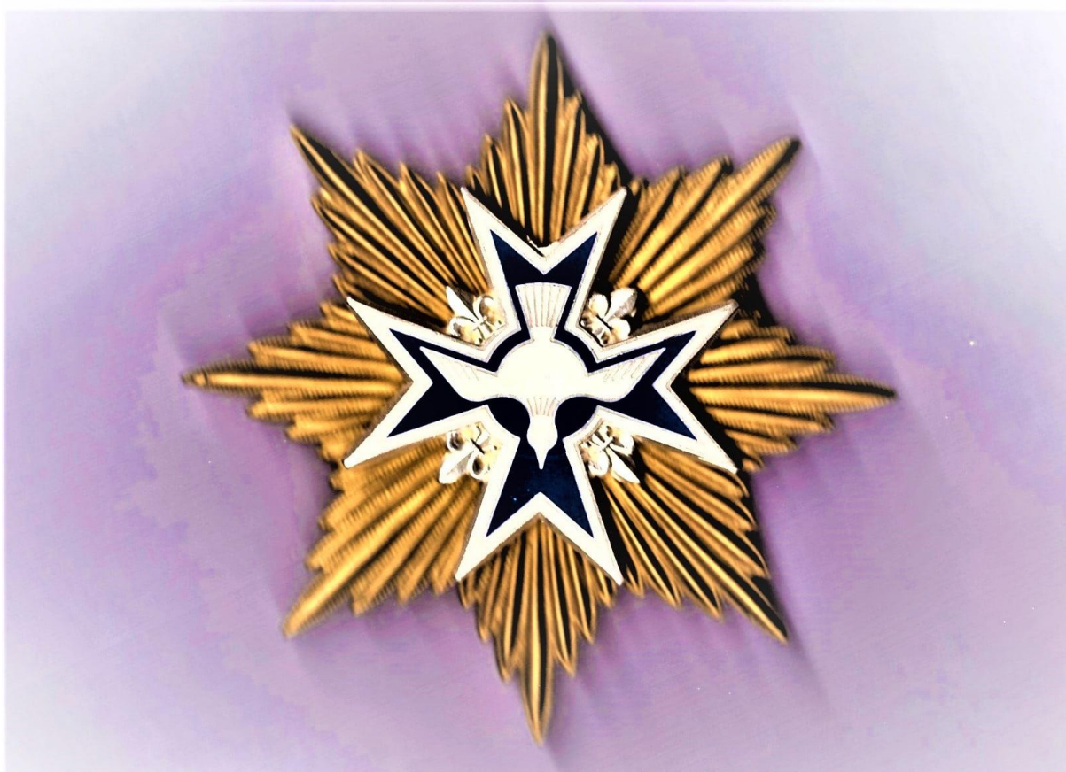
Plaque d'or de l'Ordre du cordon bleu du Saint Esprit.