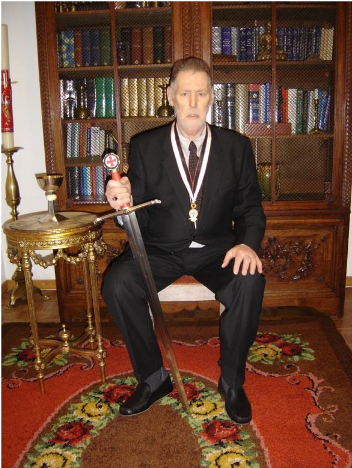
© Septembre 2021 – Ordre Souverain des Frères Aînés Rose+Croix, Belgique (Marque Déposée)